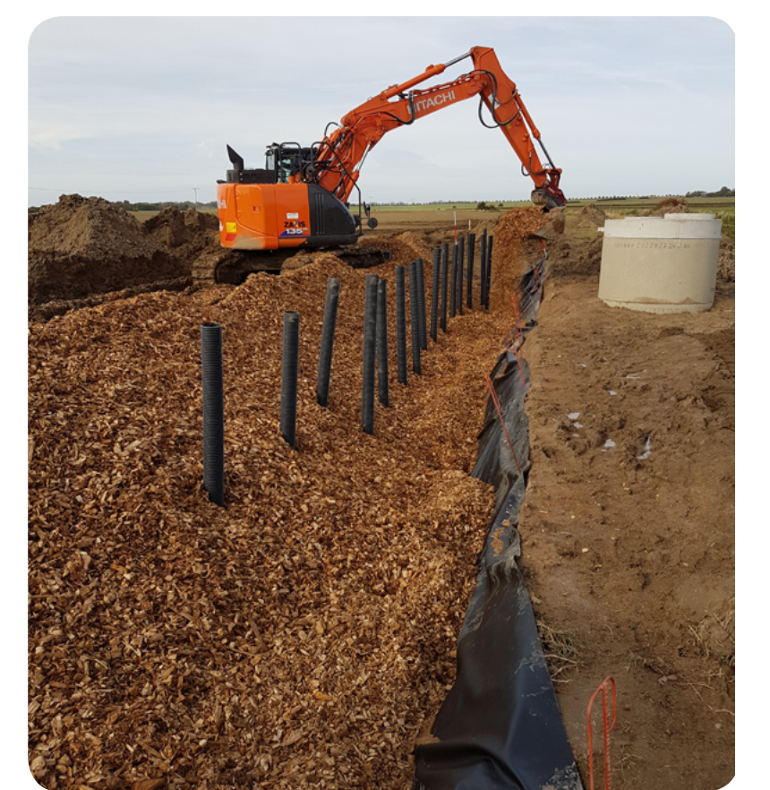
Bau Draingraben 2017